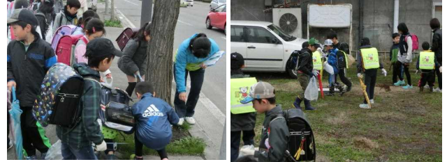
肌寒い天気でしたが、みんな一生懸命に活動しました。

知新小学校の児童や職員が、市民委員さんや民生委員さん、保護者の皆様と一緒に歩道を中心としたゴミ拾いを行いました。ゴミ拾いは集団下校班ごとに行いました。協力してくださった皆様、本当にありがとうございます。