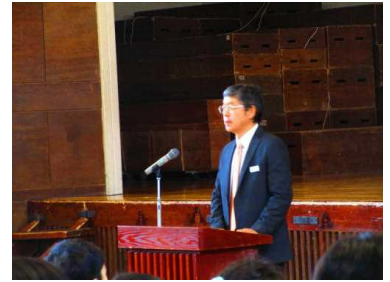
言葉についてのお話をする校長先生

学校での取り組みが家庭にも広がればと思います。知新っ子から各家庭へ、「ふわふわ言葉」や「クッション言葉」が広がるようご協力お願いいたします。