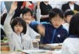
積極的に参加します