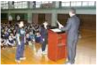
11月全校朝会での表彰

毎月の全校朝会では学校から斡旋した応募作品が入賞した場合を中心に表彰を行っています。