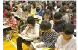
ゾウの絵を描く様子