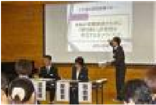
先生方も積極的です