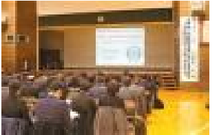
算数の指導法を学んだ講演会

11月24日(金)に、 授業力向上セミナー を開催しました。旭川市内及び上川管内から70名ほどの教員が参加しました。