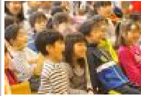
お話に驚く子どもたち