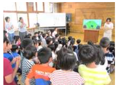
図書ボラの読み聞かせ

このように、知新小学校ではたくさんの方々が、子どもの読書活動に関わって下さっています。そのため、知新っ子は読書が大好きです。