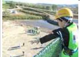
こんなに高く上がりました