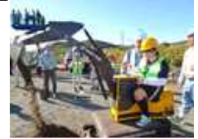
操作も行いました