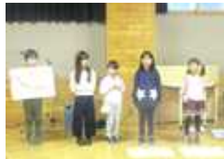
歯切れの良い暗唱活動