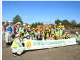
集合写真もドローンが撮影

この見学会は、「公共工事や建設業への理解を深めてもらい、身近なものとして感じてもらうため」に、旭川建設業協会と北海道開発局が開催しました。旭川市では2回目の試みですが、知新小学校児童は2年連続で参加することができました。担当者が石狩川支流のウップツ川水門建設工事の概要や必要性について説明した後に、「ドローンデモ飛行見学」と「高所作業車試乗体験」等を行いました。貴重な体験を通して、公共工事や建設業に対して理解を深めた一日となりました。※保護者の方に参加いただきました。本当にありがとうございました。