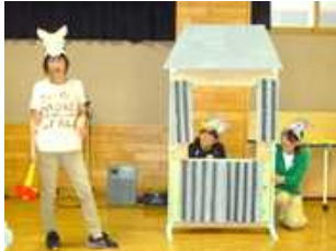
先生方による楽しい劇

9月26日(水)に知新小の特別支援学級・通級学級の児童を対象に「お話を聞く会」が行われました。子どもたちによる影絵や暗唱活動、担当している教員による大型絵本の朗読や寸劇の発表がありました。子どもたちの頑張りが見られたひとときとなりました。