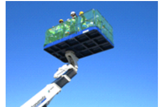
高所作業車試乗体験