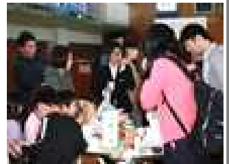
みんなで楽しく会食

PTA総会では、議事が滞りなく進行し、新役員が選出されました。11:30からは体育館でPTA歓迎会が行われました。児童・保護者・教職員の三者で楽しく会食・懇談が行われました。会の後半には教職員の自己紹介も企画されていました。