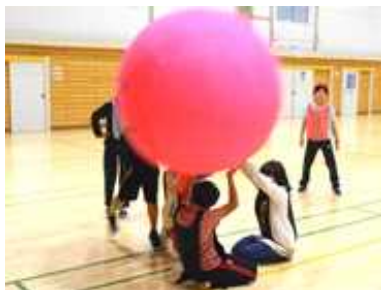
キンボール(新しいスポーツを体験！)