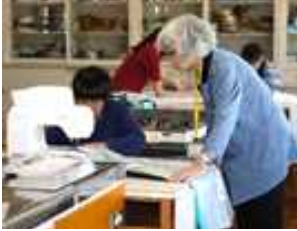
5年生の活動の様子