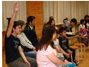
楽しんで参加しています