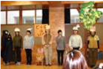
担当教員による寸劇

9月26日(木)に知新小の特別支援学級児童・通級学級児童を対象に「お話を聞く会」が行われました。影絵や、大型絵本の朗読や教員による寸劇の発表がありました。子どもたちが集中して聞いたり、笑顔で参加したりする様子が見られた楽しいひとときとなりました。