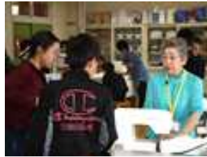
6年生の活動の様子

家庭科の裁縫では針や糸だけでなくミシンを使用することが多く、補助に入っていると一人一人の作業状況に応じた指導ができるだけでなく、子どもの安全面も配慮が行き届き、学習が充実します。