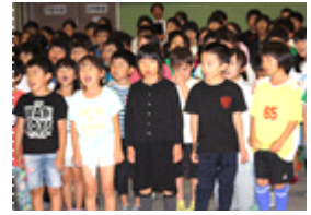
子どもたちとのハーモニー