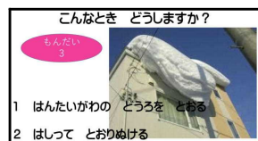
各学級で使用した資料(一部)

今後予想される暴風雪から身を守るなど防災意識を高めるため、防災教室を全学級で行いました。