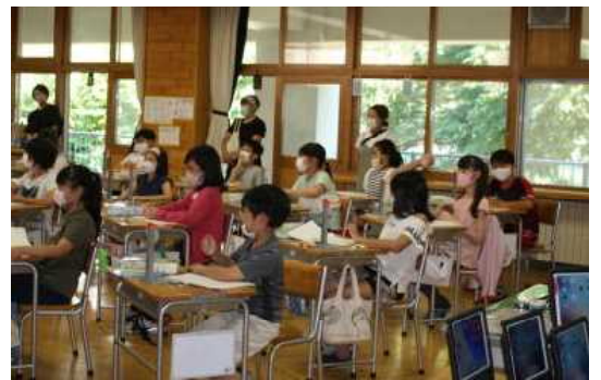
9月2日分散参観日(写真は5年1組)

さて、9月2日・3日・7日の3日間で分散参観日を開催しました。ご多用の中を多数の皆様にお越しいただき、大変ありがたく思っております。学級懇談が行えず申し訳なかったのですが、子どもたちが新型コロナ対策の様々な制限の中、頑張ってお勉強の様子をご覧いただけたのではないかと思います。「学校の新しい生活様式」を推進するに当たり、今後とも保護者の皆様の協力をいただくことが多々あるかと思いますが、どうぞよろしくお願いいたします。