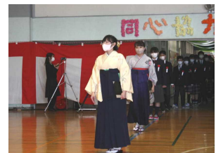
卒業生の入場の様子

6学年保護者の皆様、本当におめでとうございます。コロナ禍でしたが素晴らしい卒業式になりました。